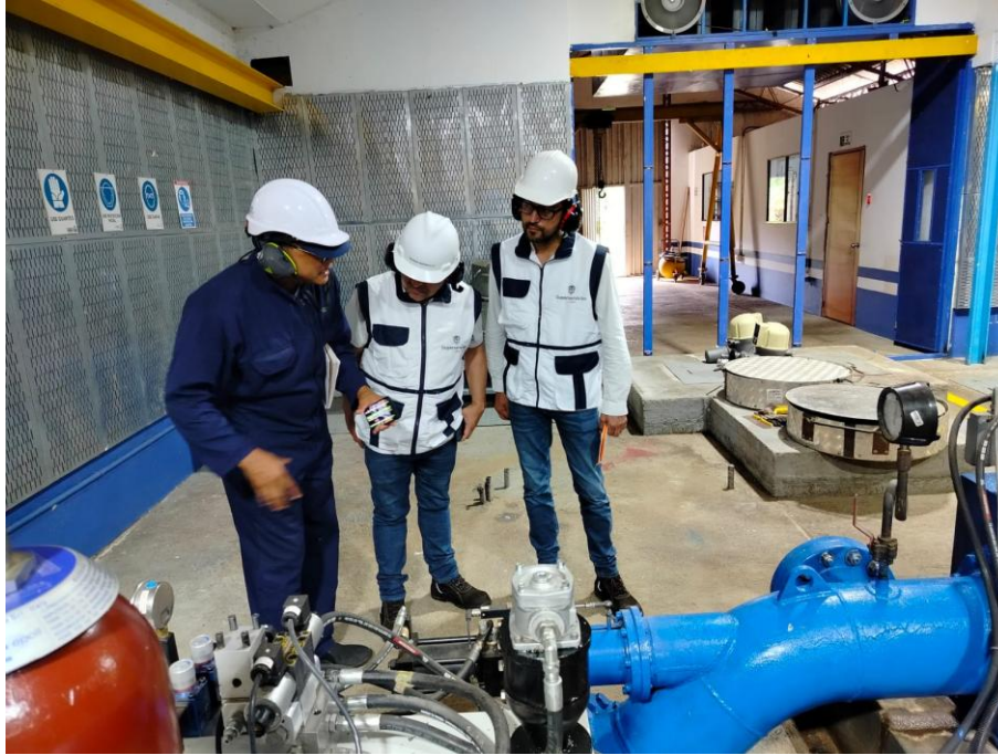
Aspecto de la visita y recorrido que hicieron los delegados de la SSPD en Bahía Solano.