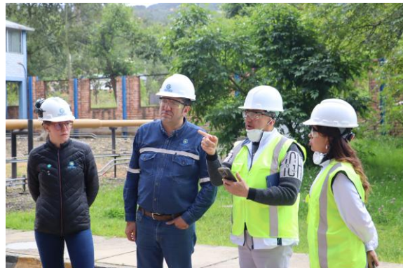
Equipo de la SSPD durante el recorrido por Termopaipa.