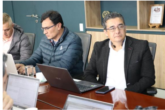
Aspectos de la reunión y representantes de la SSPD que visitaron la sede de Manizales.