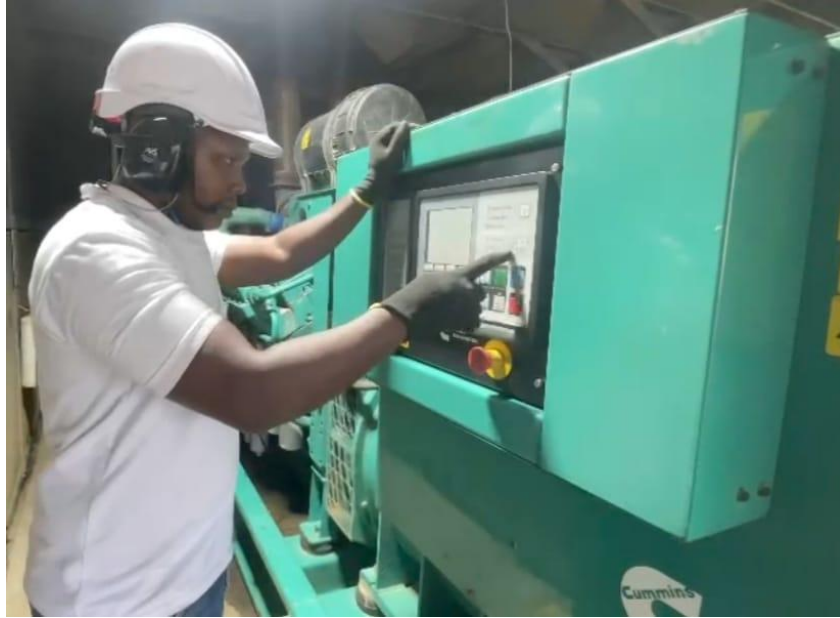
Colaborador de Bahía Solano que se certificó.