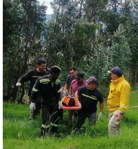
Participación en las diferentes actividades programadas.