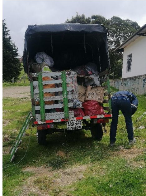
Aspectos positivos de la recolección de residuos.