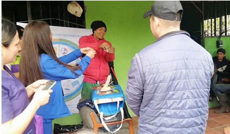
Participación activa de diferentes grupos de interés en la actividad.

Gensa destaca la participación y el apoyo de todos los aliados que contribuyeron para la consecución de estos resultados y continuará el trabajo conjunto para alcanzar una minería sostenible para el territorio.